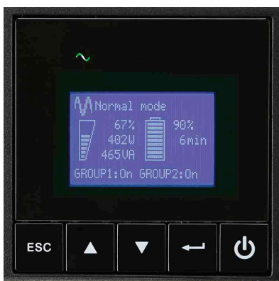
Grafisches LCD-Display der 9SX