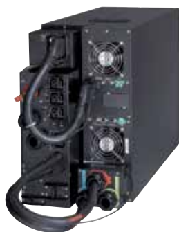
9PX 11kVA avec bypass de maintenance