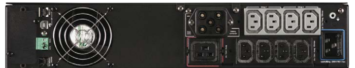
5PX von 1500VA bis 3000VA