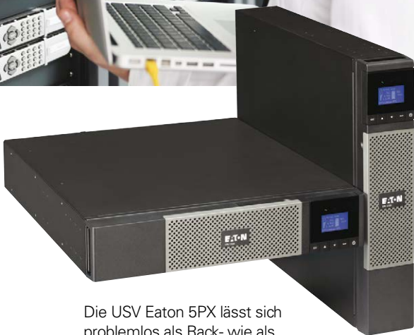
Die USV Eaton 5PX lässt sich problemlos als Rack- wie als Towermodell einsetzen.