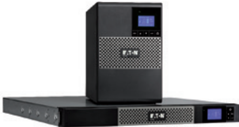
Als Tower- und als 1HE-Rackversion erhältlich