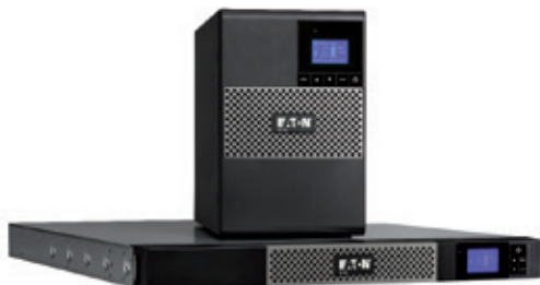
Als Tower- und als 1HE-Rackversion erhältlich