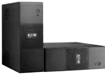
Die Eaton 5S ist flexibel.