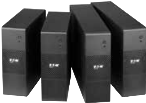
Produktübersicht USV Eaton 5S