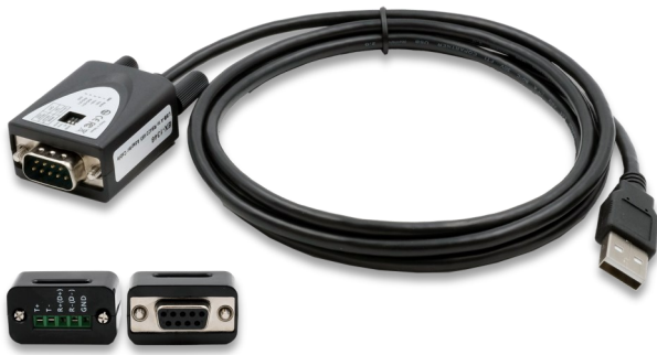
Inkl. Adapter 9 Pin Buchse zu 5 Pin TB Incl. Adapter 9 pin female to 5 pin TB