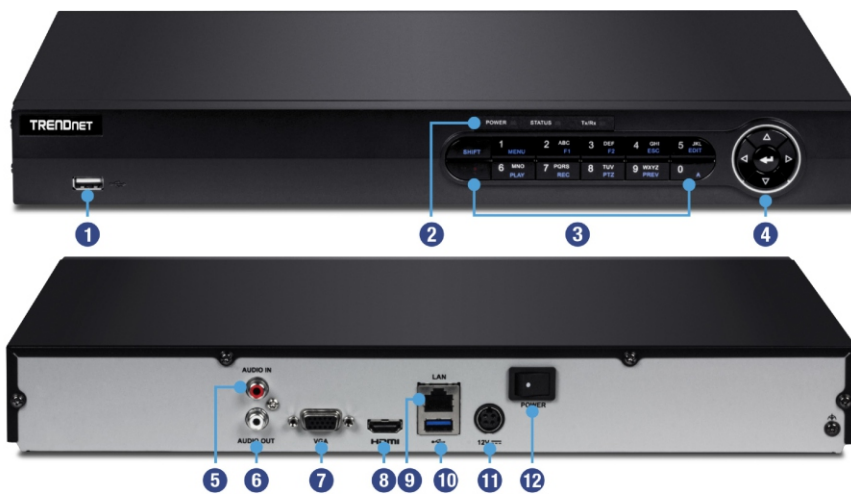
Illustration Eines Network

Benutzer erleben die Verwaltungsoberfläche als intuitiv und einfach zu verwenden – schnelle Navigation von Liveansichtseinstellungen, Aufzeichnungsplänen und fortschrittliche Wiedergabeoptionen.