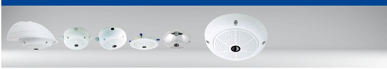
Outdoor-Wandhalter Aufputz-Set 10° Vandalismus-Set Aufputz-Set Unterputzmontage-Set